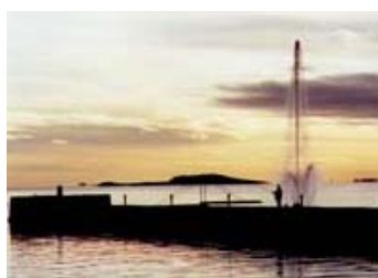
Stemming fra Sjøbadet

INFORMASJONSAVIS FOR MEDLEMMER I MOSS MOTORBÅTFORENING