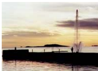
Stemming fra Sjøbadet

INFORMASJONSAVIS FOR MEDLEMMER I MOSS MOTORBÅTFORENING