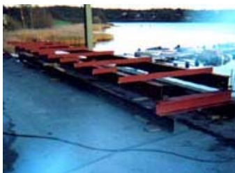
Ny brygge under arbeid

vil bli montert fortøyningsbommer. Styret har gått inn for dette for å få satt en strek for de gamle akterfester og likeledes gjøre fortøyninger mer ensartet. En del av de båtene som tidligere lå på den gamle trebrygga, vil bli flyttet til andre plasser i havna, og noen av de større båtene hvor man kan gå rett inn på dekket fra høy brygge vil bli vurdert flyttet inn til denne brygga. Dette blir en kabal for båt plassjefen.