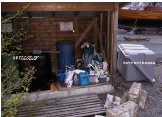
Bildet viser innholdet i Miljøboden – litt av en miljøbod.

Båtlivet gir verdifullt næringsgrunnlag - også i skrinne kyststrøk