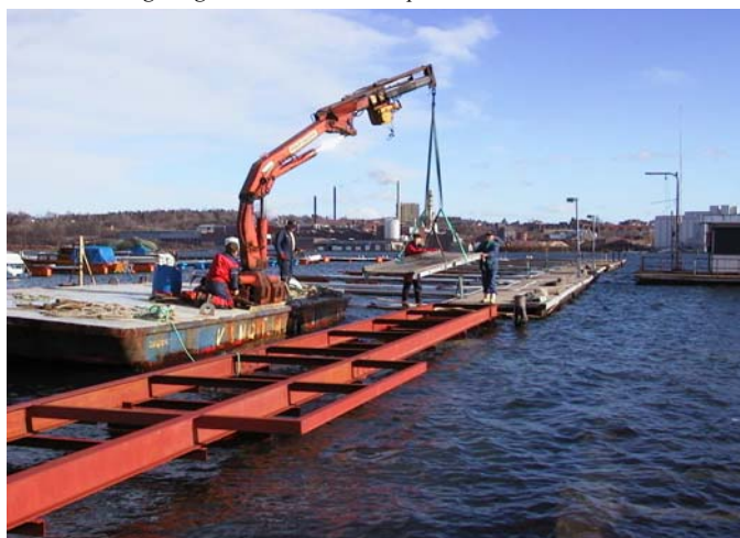
Ny brygge under arbeid

Fortøyningsbommer er bestilt og er kanskje under montering, når dette leses.