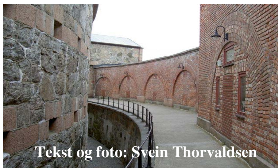
Tekst og foto: Svein Thorvaldsen

Hvordan ville krigens utvikling bli, hvis ikke kommandanten på Oscarsborg festning hadde forsinket innmarsjen til hovedstaden?