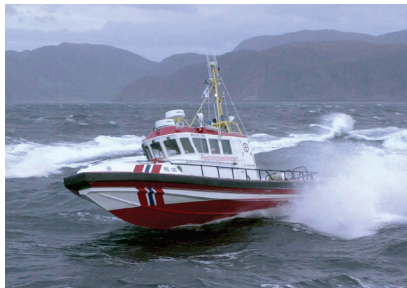
RS 120 "Sundt"

De som ønsker å være med i korpset må være medlem i redningsselskapet; enten Kystpatrulje-medlem eller støtte-medlem. Hører vi fra deg?