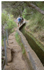
Levada på Madeira

Madeira er et velkjent reisemål for oss nordmenn. En turistghetto vil nok mange hevde, men øya har nok sin sjarm og sine kvaliteter som overgår mange andre reisemål på sydlige breddegrader. Hvis man ønsker å prioritere strandlivet er ikke Madeira det rette stedet. Her finnes knapt en sandstrand, men til gjengjeld er det laget "havsbad" flere steder på øya, hvor naturlige fjellformasjoner og klipper er avstengt fra havet ved at det er bygget opp bølgebrytere utenfor,