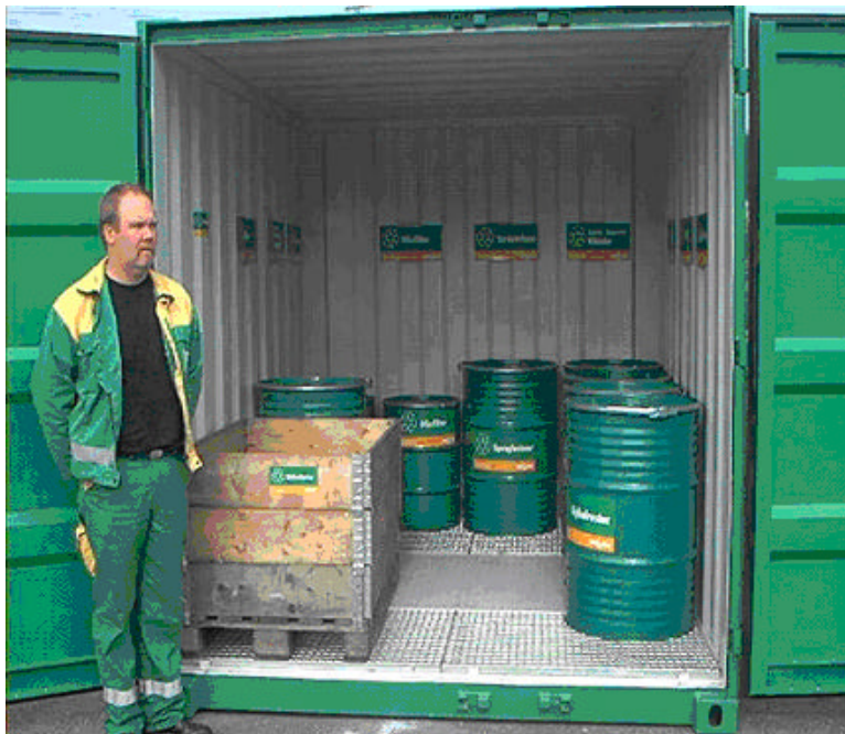
Containerne settes ut og merkes for sortering av avfall

Ragn-Sells AS vil sette ut to miljøcontainere som bildet viser med forbehold om små justeringer. Personen på bildet er ikke inkludert! Vi håper imidlertid å kunne stille med en person under vårpussen for å svare på spørsmål om farlig avfall og hjelpe dere i gang med sorteringen av farlig avfall.