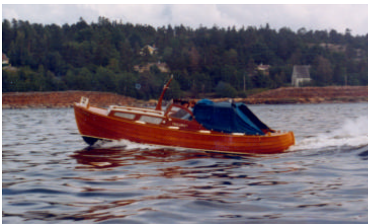
Det var den gangen båter var trebåter. Her er "Veslemøy" i fint driv