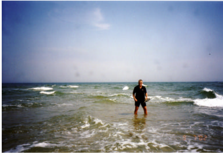
Der to hav møtes