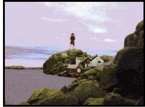
"Svennerhavna" med fyret på toppen

Svenner fyr blir automatisert og fraflyttet, men stedet vil fortsatt bestå som et populært reisemål for båtfolk fra nær og fjern.